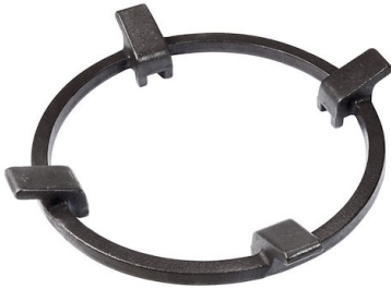
Soporte para Wok de hierro fundido